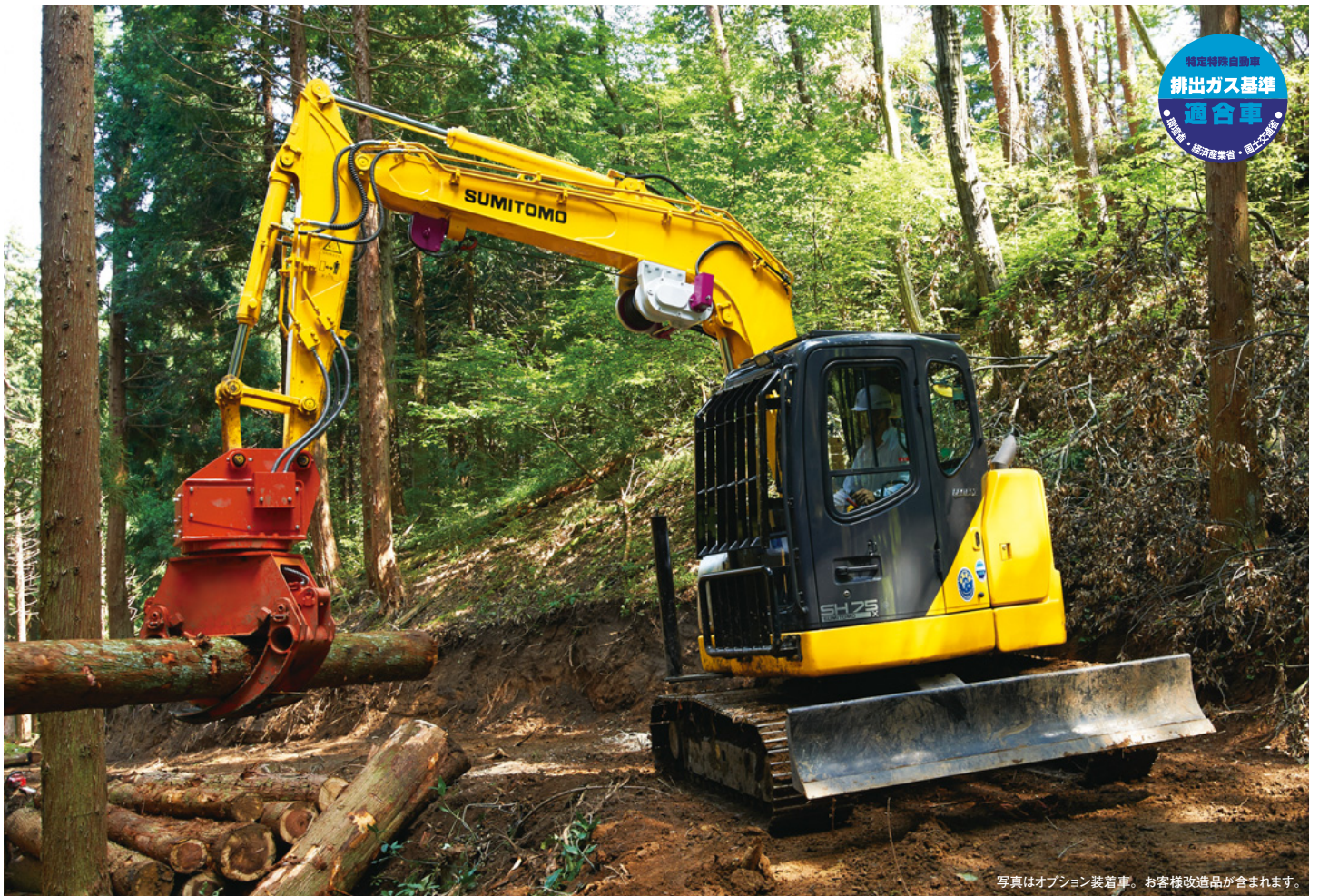
写真はオプション装着車。お客様改造品が含まれます。